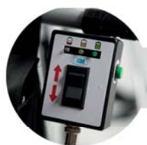
Comando de elevação e indicador de nível de bateria