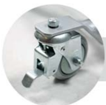
Rodas traseiras com freio de segurança