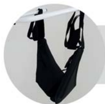
Cinta torácica e apoio de joelho em nylon com almofada